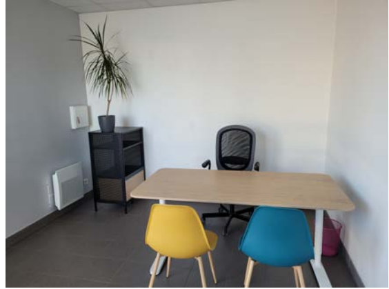
Bureau 11 m 2 — à titre indicatif