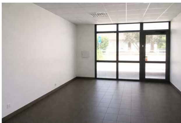
Grande salle — vue façade parking