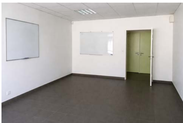
Grande salle — 2 tableaux blancs, accès couloir