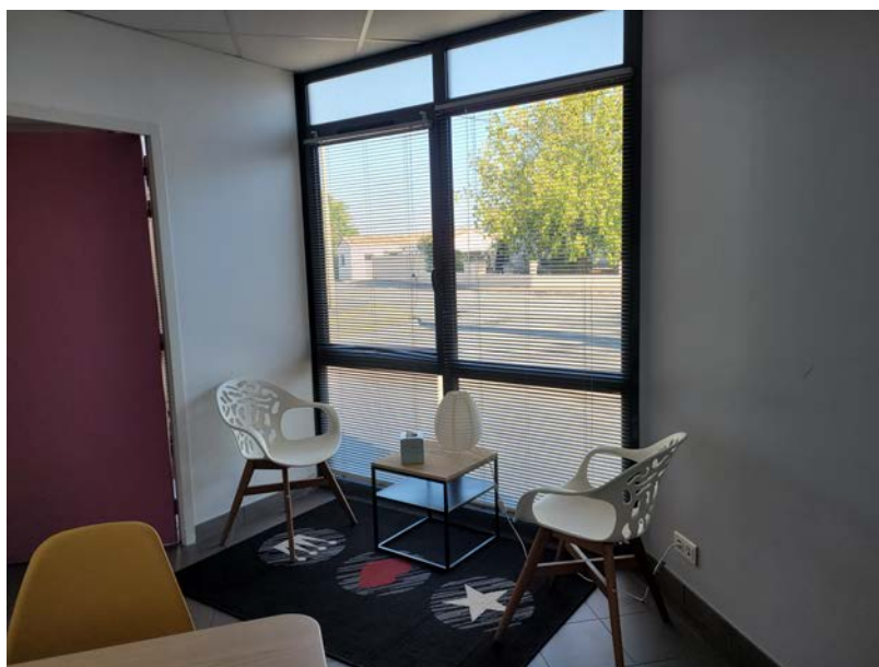
Espace accueil / showroom — aménagement à titre indicatif