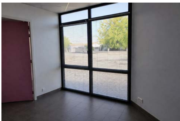
Accueil vitrine — vue latérale