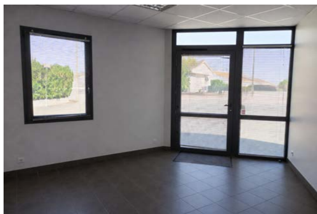
Accueil showroom — entrée indépendante