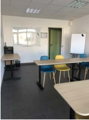
Salle aménagée — à titre indicatif