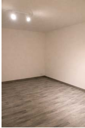
Bureau privatif ou Espace archive ~11 m 2 — parquet