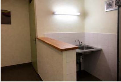
Tisanerie (évier + plan de travail)