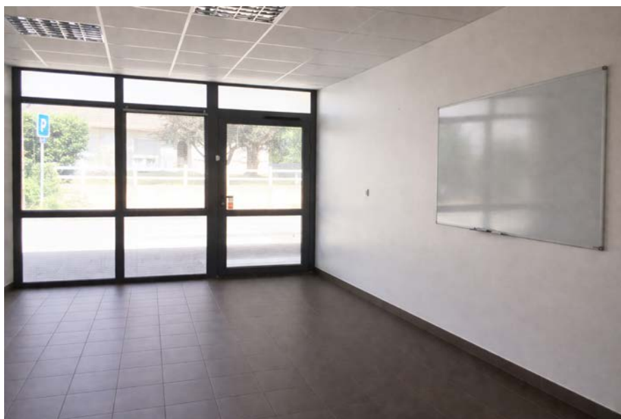
Grande salle modulable 22 m 2 — tableaux blancs muraux inclus