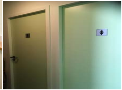
Sanitaires H/F séparés (partagés)