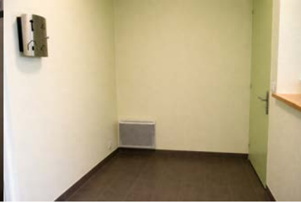
Tisanerie (partagée) 7m 2